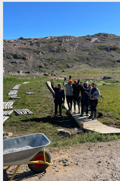
218 trin skulle de unge lægge, før broen over sumpen i Blomsterdalen var færdig. Der er brug for den til både turister og lokale.